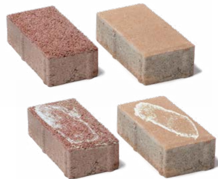
Ukázka povrchu a povrchu s cimento-vápněným výkvětem.